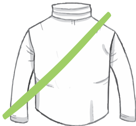
„ZU HEIß“ ICH, 16