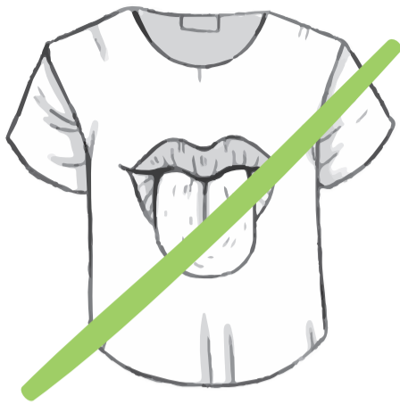
„ZU FRECH“ PAPA, 43