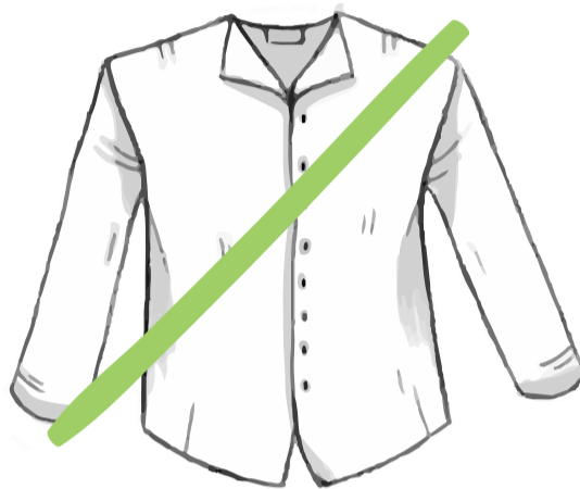
„ZU MÄNNLICH“ FREUNDIN, 15